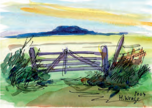
Gatter mit Vogelkoje/Föhr, 2005