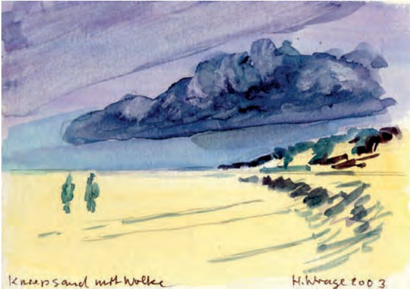
Kniesand mit Wolke, 2003