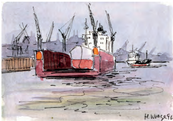
Im Hamburger Hafen, 1996