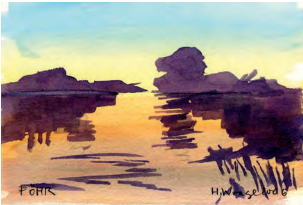
„Noldestimmung“, Föhr 2006